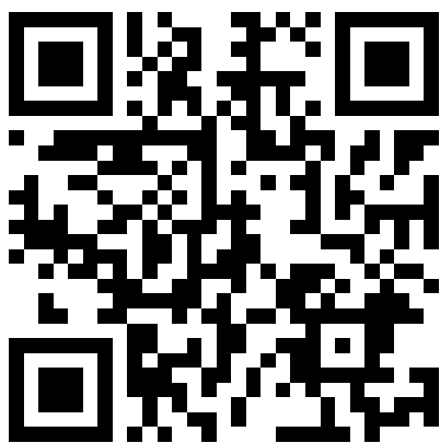
數位自學課程清單